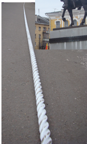
тот самый канат